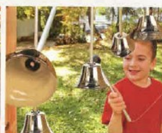
Dzwonki dostarczamy w wersji, która pokazana jest na str. 371 (art. nr 428577).

aktivPark – zestaw nr 4 Sklada się z modułów „Gong”, „Dzwonki” i słupków ze stali nierdzewnej V2A (130 cm). 429141 4690,-