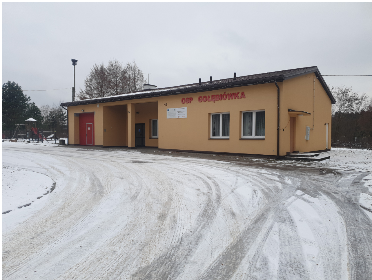
Fot. 2 Elewacja południowo - wschodnia - frontowa