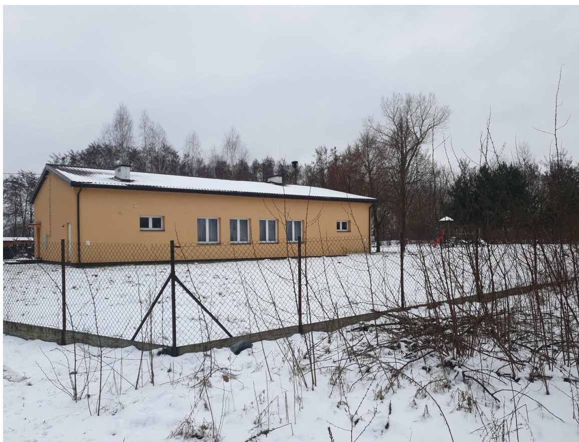
Fot.10 Miejsce przeznaczone na montaż paneli fotowoltaicznych