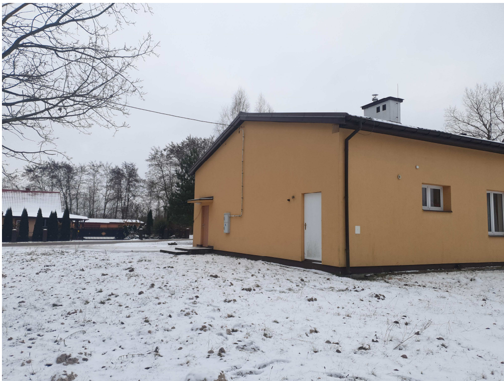
Fot. 5 Elewacja północno – wschodnia