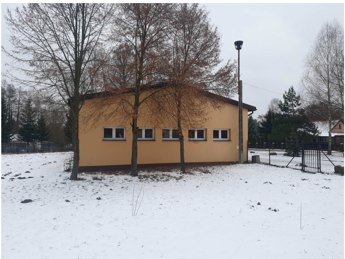
Fot. 4 Elewacja południowo – zachodnia