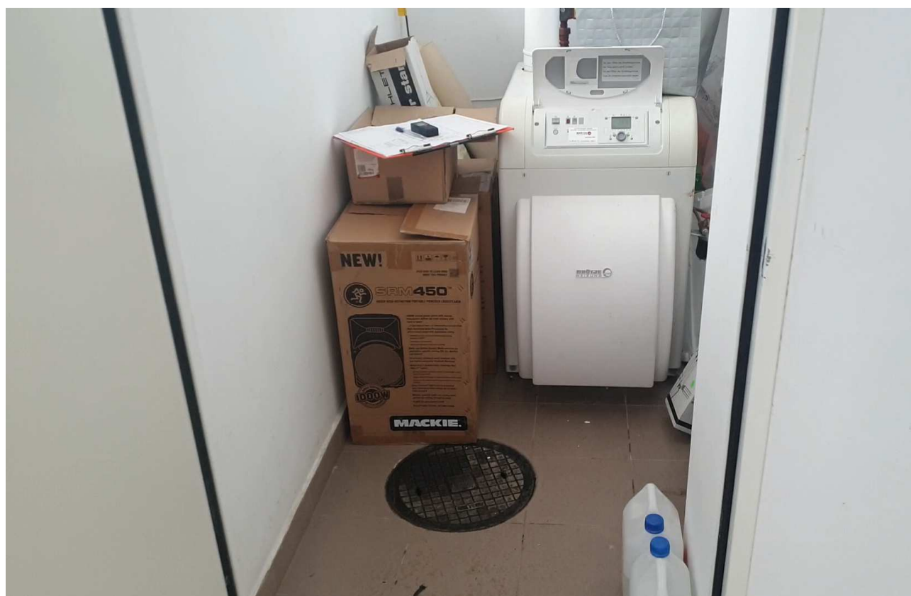
Fot. 6 Istniejące źródło ciepła w kotłowni – stojący kocioł olejowy