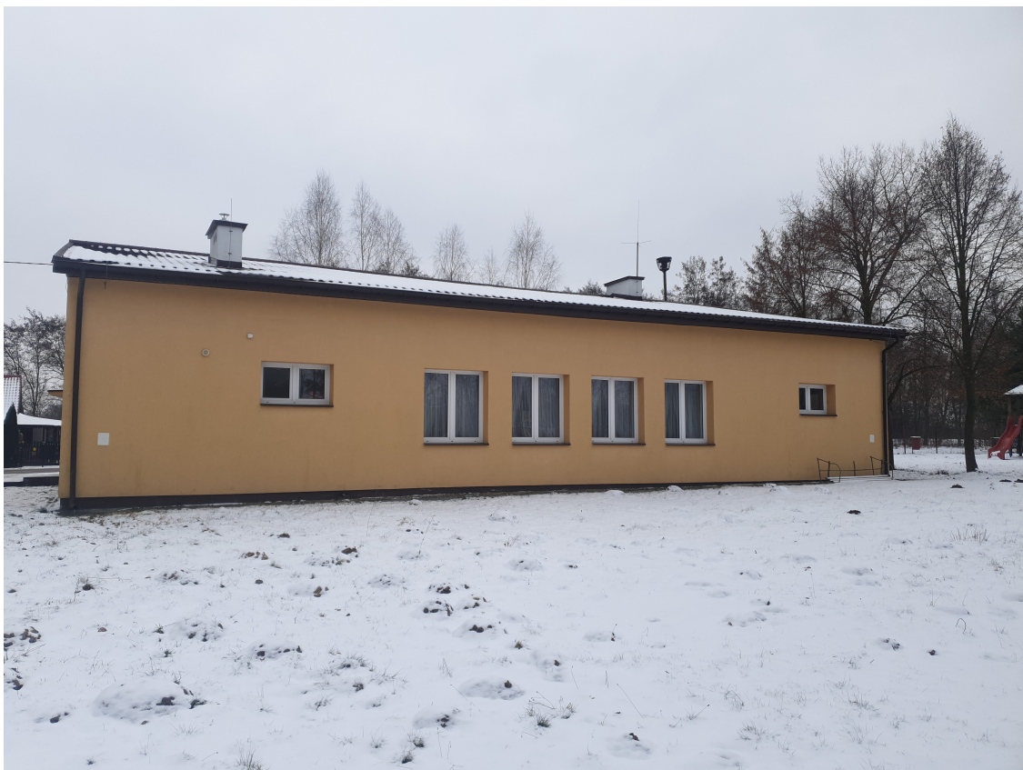
Fot. 3 Elewacja północno – zachodnia