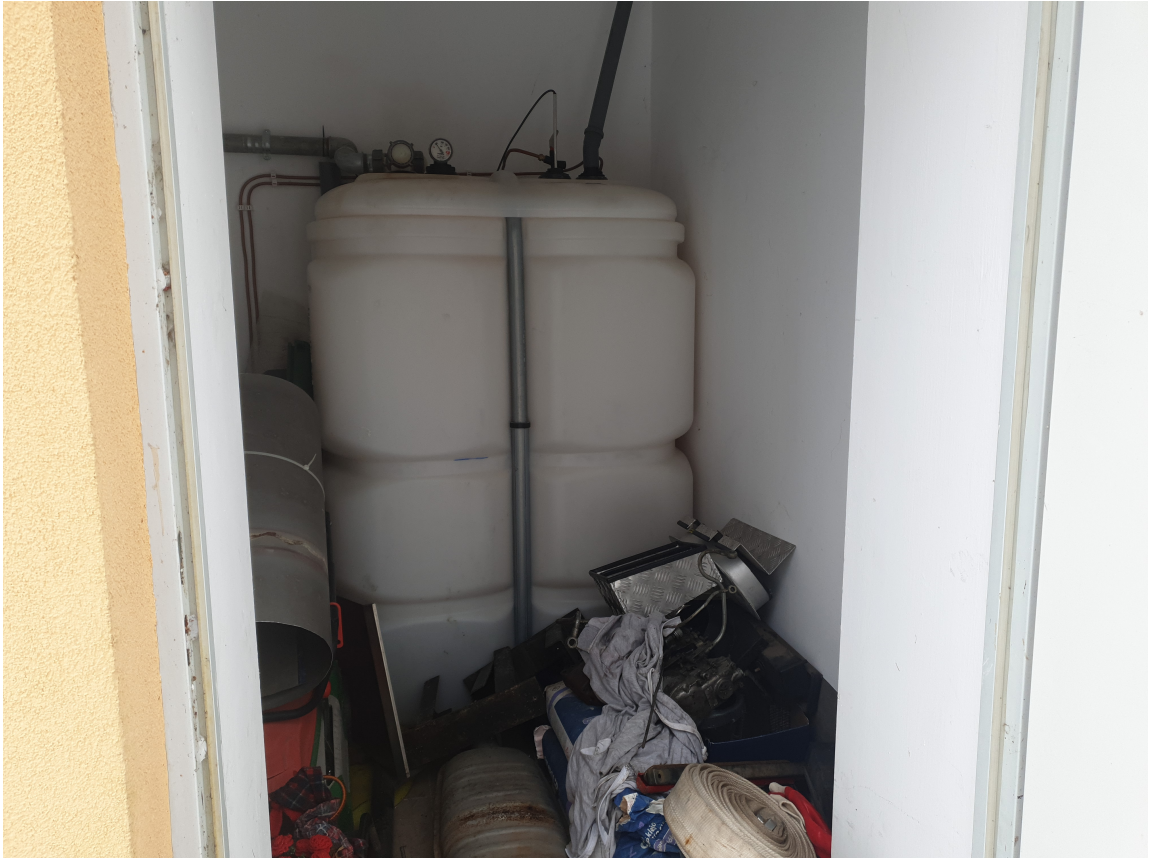
Fot.7 Istniejący zbiornik oleju