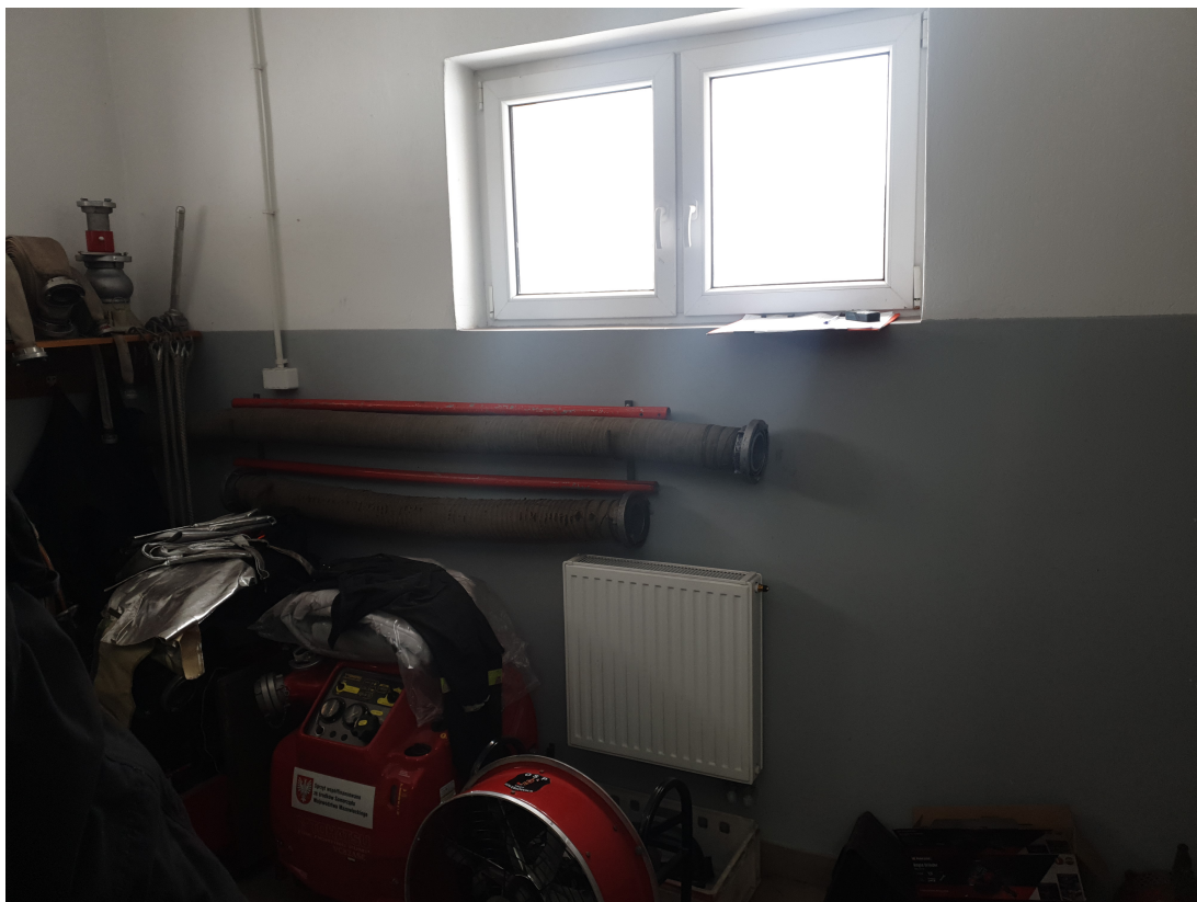
Fot.9 Odbiornik ciepła – grzejnik płytowy